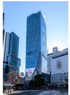
▲渋谷スクランブルスクエア外観

U R L : https://www.shibuya-scramble-square.com